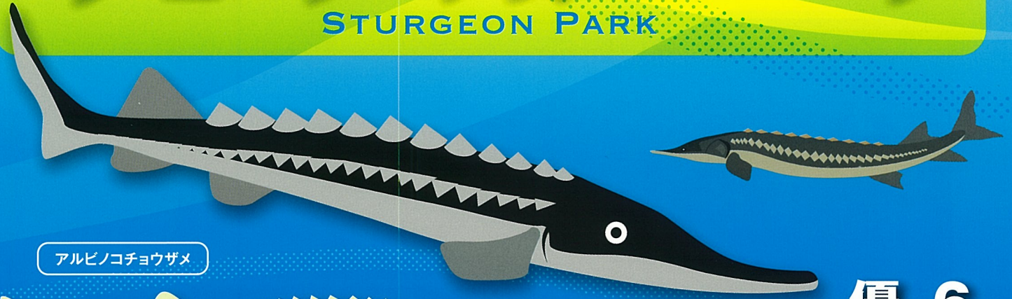
アルビノコチョウザメ