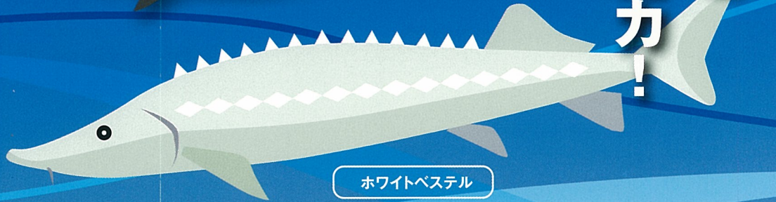
ホワイトベステル